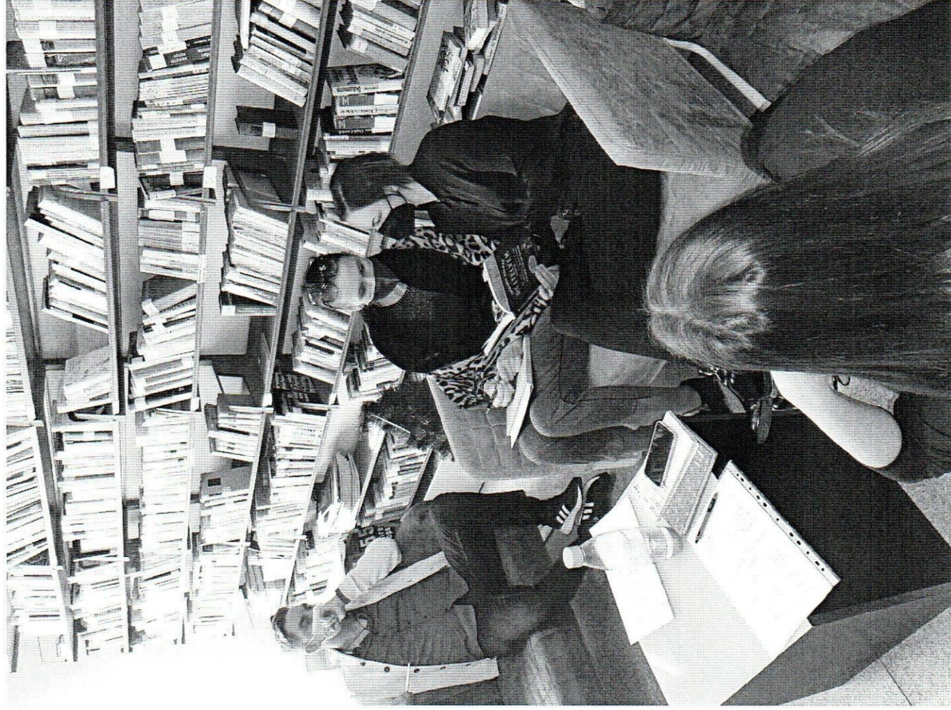
Stredná zdravotnícka škola – Egészségügyi Középiskola Športová ulica 349/34 929 01 Dunajská Streda Zasadnutie klubu bez písomného výstupu – Klub čitateľskej gramotnosti z dňa 11.10.2021